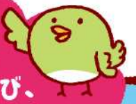
イマジネーション プレイグラウンド

「あそらぼ」は 家族で遊び、学び、 ココロとカラダを育む 「ボーンランド」の遊具を 使ったプレイランド!