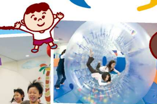
サイバーホイール